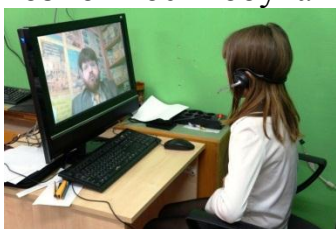
индивидуальная работа с учащимися

В сентябре 2012 года учащиеся школ Кировской области получили уникальную возможность обучаться дистанционно.