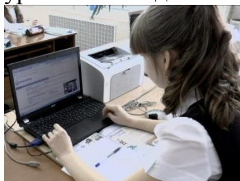
Расширение словарного запаса на on line ресурсе multitran.ru

При производственной необходимости и целесообразности, когда на уроке присутствует целый спектр моментов нагрузки с оснащением урока, в работе используется так называемая карта урока тьютора. В ней прописывается ход урока и последовательное использование всего необходимого оснащения.