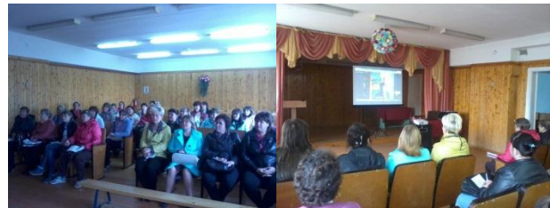
Организационное родительское собрание перед началом нового учебного года

Как известно, результат зависит от всех сторон образовательного процесса: учителей, учащихся и, конечно же, их родителей. Очень важным элементом работы сетевого педагога, минуя звено тьютора, являются родительские собрания в режиме on-line, когда на местах с родителями обсуждаются как организационные вопросы, так и индивидуальная траектория обучения.