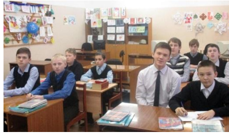
Рождество и Новый Год