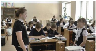
Диалогическая речь, продвинутая группа в параллели

С каждым годом такая форма обучения иностранному языку приобретает популярность. Количество учащихся в группах колеблется от 2 до 19 человек в группе. В зависимости от состава группы, а также, целей и задач каждого урока используются различные формы организации работы: как фронтальная, так и групповая, как парная, так и индивидуальная.